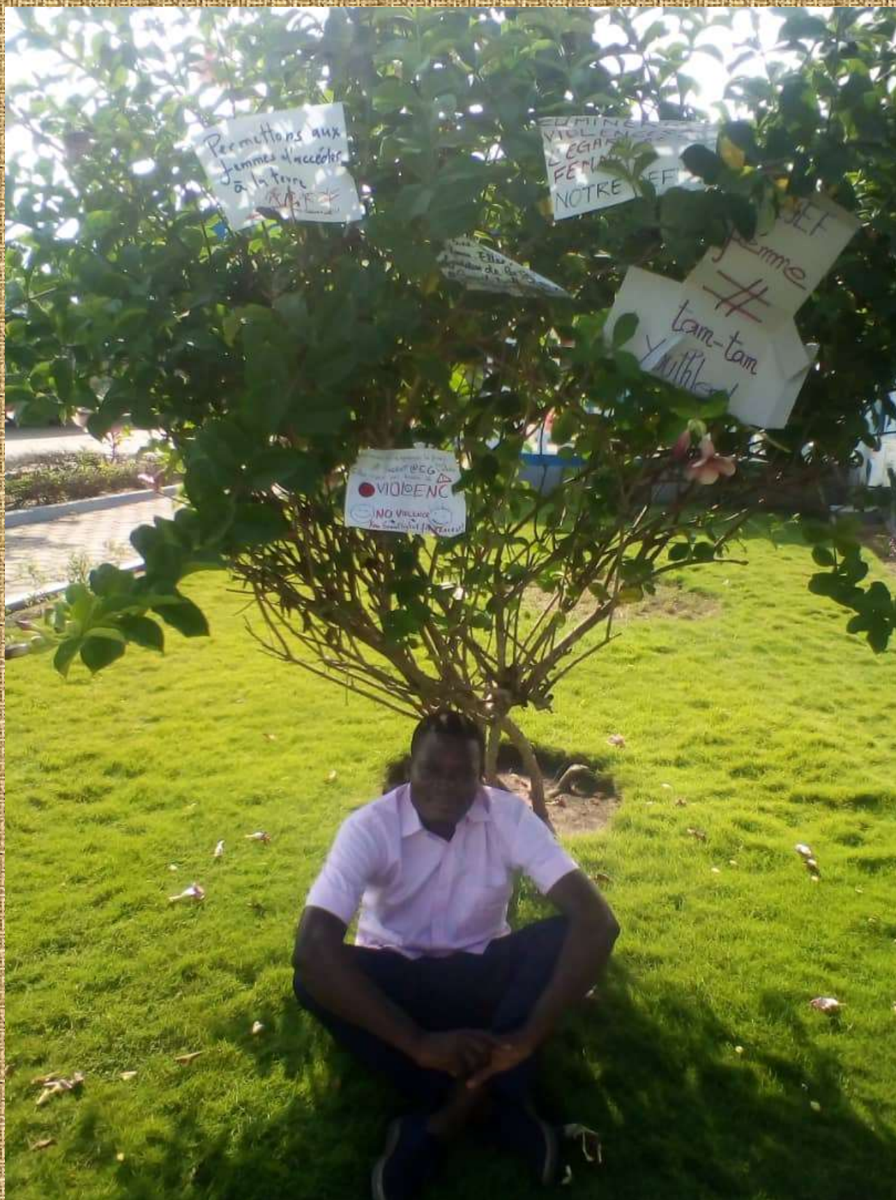
PHOTOS PRISES LORS DES DECLARATIONS DES MESSAGES CLES DE LUTTE CONTRE LES VIOLENCES FAITES AUX FILLES ET AUX FEMMES AU TOGO.