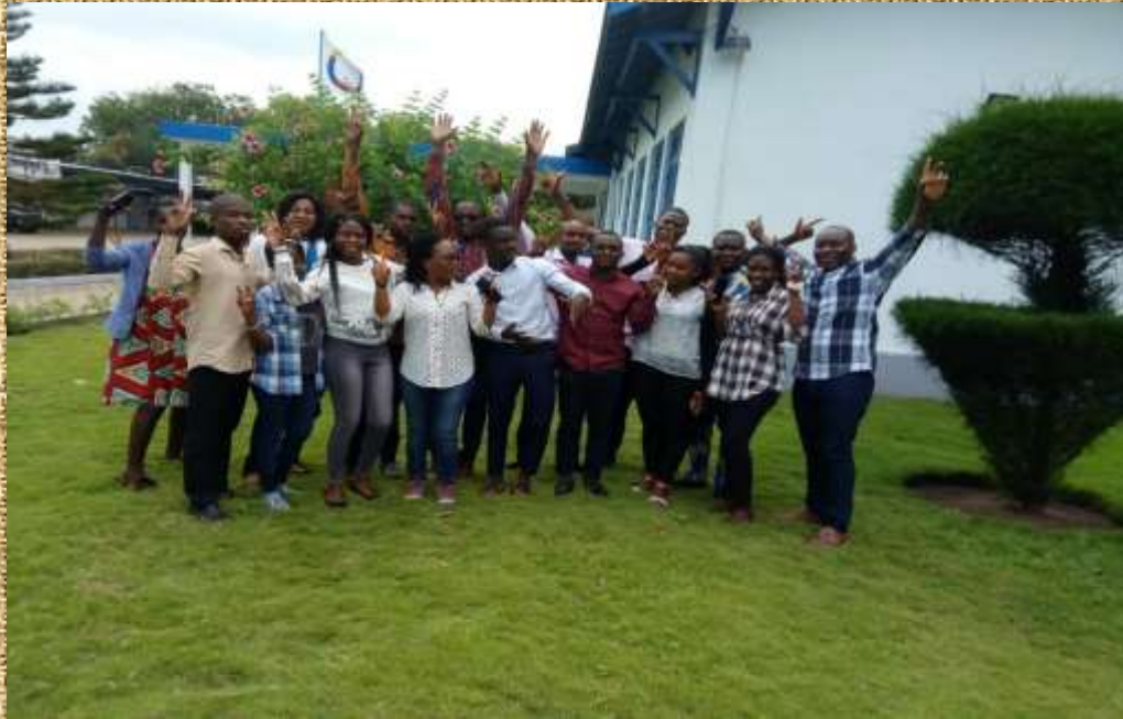
PHOTO DE FAMILLE PRISE LORS DE L'ACTIVITE